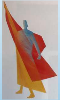
両極を貫く母音 | イー