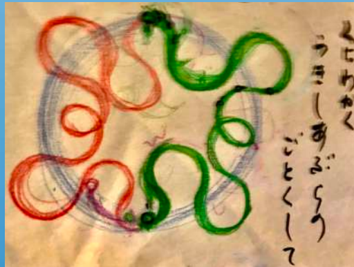
古事記のフォルム